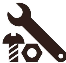
Schrauben / Muttern