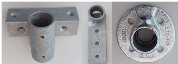
Winkel- und/oder Fusssockel